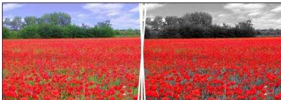
Voorbeeld van een gedeeltelijke ontkleuring in een landschapsfoto

Het PFI-formaat bestaat uit de originele afbeelding als achtergrondlaag en een laag in grijswaarden. De transparante gebieden in de grijswaardenlaag komen overeen met de gekleurde delen.