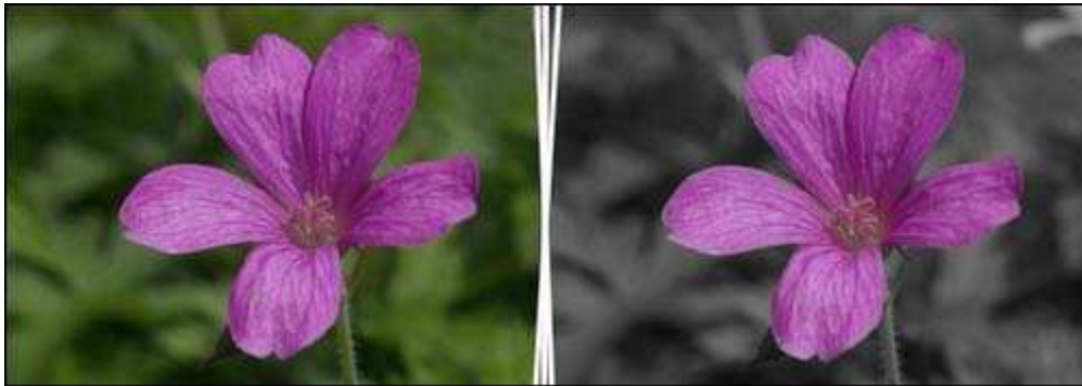
Gedeeltelijke ontkleuring (desaturatie) van een bloemfoto

Met Photo Black & Color kunt u een afbeelding gedeeltelijk ontkleuren door de kleuren die bewaard moeten blijven te selecteren. Bij gedeeltelijke ontkleuring (desaturatie) houdt een onderdeel zijn kleur, terwijl de rest van de afbeelding in grijswaarden wordt weergegeven.